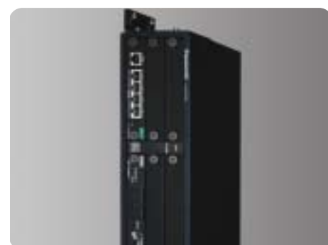
Staffa per montaggio a parete KX-NCP500X/V