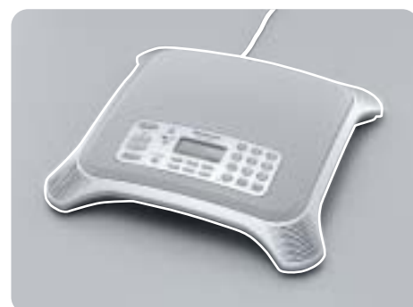
Sistema per conferenze IP KX-NT700

Sia NCP500X che NCP500V sono dotati di serie di staffe per il montaggio a parete.